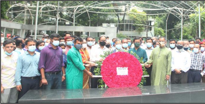
জাতির পিতা বঙ্গবন্ধুর প্রতিকৃতিতে নব নিযুক্ত উপাচার্যের শ্রদ্ধাঞ্জলি নিবেদন