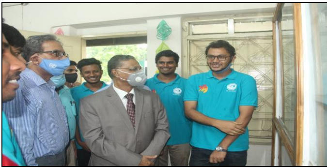
‘শহীদ সাংবাদিক সেলিনা পারভীন স্মৃতি পাঠাগার’ উদ্বোধন করছেন উপাচার্য