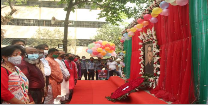
জাতীয় শিশু দিবস ২০২১ উপলক্ষে বঙ্গবন্ধুর প্রতিকৃতিতে জগন্নাথ বিশ্ববিদ্যালয়ের পক্ষে শ্রদ্ধাঞ্জলি নিবেদন

এ সময় বিশ্ববিদ্যালয়ের বিভিন্ন অনুষদের ডিন, ইনস্টিটিউটের পরিচালক, রেজিস্ট্রার, বিভাগীয় চেয়ারম্যান, শিক্ষক, বেগম ফজিলাতুল্লাহ মুজিব হলের প্রভোস্ট ও হাউজ