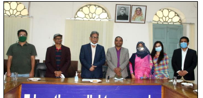
পাণ্ডুলিপি প্রকাশ সংক্রান্ত চুক্তি স্বাক্ষর অনুষ্ঠানে উপস্থিত ট্রেজারার, সংশ্লিষ্ট লেখক ও অন্যান্যরা