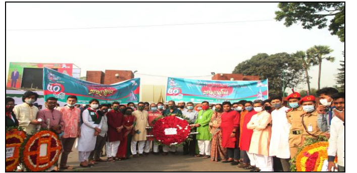
স্বাধীনতার সুবর্ণজয়ন্তী ও জাতীয় দিবস-২০২১ উপলক্ষে জগন্নাথ বিশ্ববিদ্যালয়ের শ্রদ্ধাঞ্জলি নিবেদন