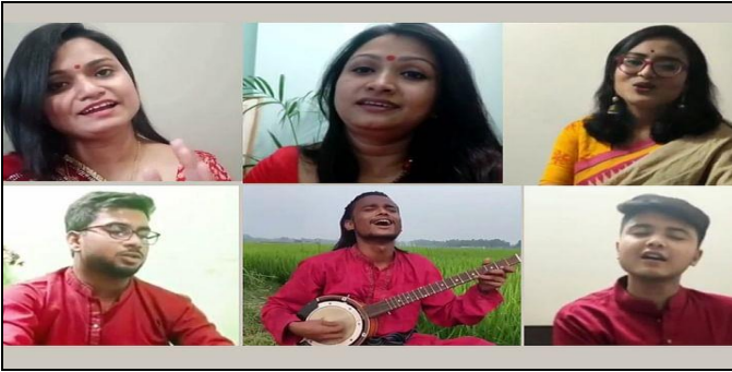
বাংলা নববর্ষ ১৪২৮ উপলক্ষে জগন্নাথ বিশ্ববিদ্যালয় আয়োজিত ভার্সুয়ালি সাংস্কৃতিক অনুষ্ঠান

করোনা মহামারীর কারণে এবার ভার্সুয়ালি বাংলা নববর্ষ ১৪২৮ পালন করেছে জগন্নাথ বিশ্ববিদ্যালয়। ১ বৈশাখ (১৪ এপ্রিল) বিশ্ববিদ্যালয়ের ফেসবুক পেজ (JnU Prip Dhaka)-এর মাধ্যমে বাংলা নববর্ষ অনুষ্ঠানটি সম্প্রচারিত হয়।