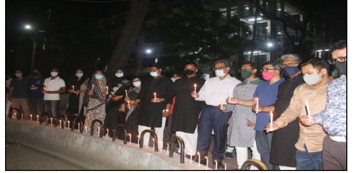
২৫শে মার্চ জাতীয় গণহত্যা দিবস উপলক্ষে '৭১-এর গণহত্যা ও মুক্তিযুদ্ধের প্রস্তুতি' ভাষ্কর্য চত্বরে প্রদীপ প্রজ্জ্বলন

২৫ মার্চ জাতীয় গণহত্যা দিবস উপলক্ষে শহীদদের স্মরণে জগন্নাথ বিশ্ববিদ্যালয়ের '৭১-এর গণহত্যা ও মুক্তিযুদ্ধের প্রস্তুতি' ভাষ্কর্যের সামনে প্রদীপ প্রজ্জ্বলনের মাধ্যমে ভয়াল কালরাত স্মরণ করা হয়।