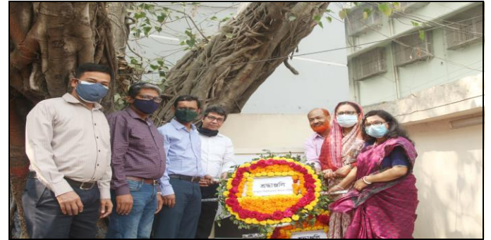
ঐতিহাসিক ৭ই মার্চ জাতীয় দিবস উপলক্ষে বঙ্গবন্ধুর প্রতিকৃতিতে শ্রদ্ধাঞ্জলি নিবেদন করা হচ্ছে

ঐতিহাসিক ৭ই মার্চ জাতীয় দিবস। এই দিবস উদযাপন উপলক্ষে জগন্নাথ বিশ্ববিদ্যালয়ের মূল গেইট সংলগ্ন বঙ্গবন্ধুর প্রতিকৃতিতে পুষ্পস্তবক অর্পণ করে সর্বকালের সর্বশ্রেষ্ঠ বাঙালি জাতির পিতা বঙ্গবন্ধু শেখ মুজিবুর রহমান এর প্রতি শ্রদ্ধাঞ্জলি নিবেদন করা হয়।