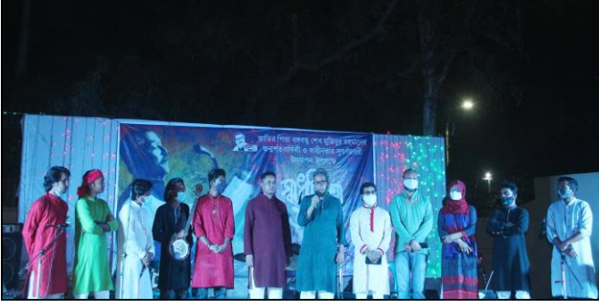
অনুষ্ঠানে প্রধান অতিথি হিসেবে বক্তব্য প্রদান করছেন দায়িত্বপ্রাপ্ত উপাচার্য