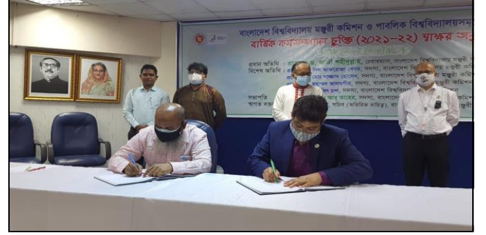
জার্নাল অব আর্টস এর মোড়ক উন্মোচন করছেন উপাচার্য

উক্ত বার্ষিক কর্মসম্পাদন চুক্তি অনুষ্ঠানে চেয়ারম্যান, সদস্যবৃন্দ, সচিব (অতিরিক্ত দায়িত্ব) এবং ২৩টি পাবলিক বিশ্ববিদ্যালয়ের রেজিস্ট্রার ও এপিএ ফোকাল পয়েন্ট উপস্থিত ছিলেন।