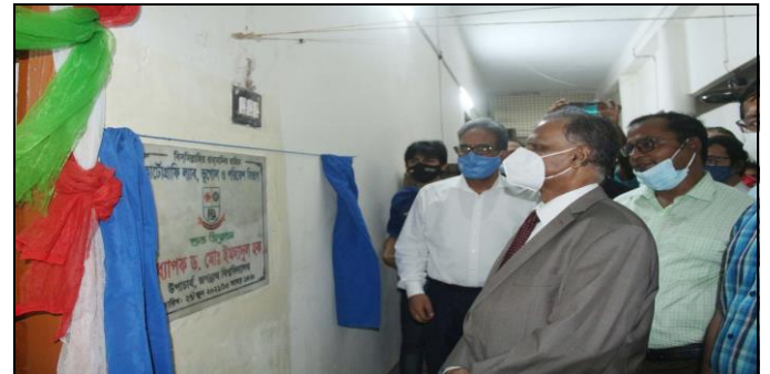
কার্টোগ্রাফি ল্যাব এর উদ্বোধন করছেন উপাচার্য