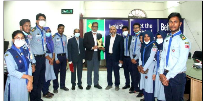
ট্রেজারার-এর সাথে জগন্নাথ বিশ্ববিদ্যালয় রোভার স্কাউটস গ্রুপের সৌজন্য স্বাক্ষার

এই ক্যাটাগরিতে দেশের সকল পাবলিক বিশ্ববিদ্যালয় এবং প্রায় সবগুলো প্রাইভেট বিশ্ববিদ্যালয়ের ৩৫০টি অধিক ক্লাব অংশগ্রহণ করে এবং সেখানে জগন্নাথ বিশ্ববিদ্যালয় রোভার স্কাউট গ্রুপ সবার থেকে এগিয়ে এবং সবচেয়ে সেরা হিসেবে স্বীকৃতি লাভ করে ক্রেস্ট অর্জন করে।