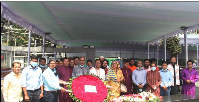
বঙ্গবন্ধুর প্রতিকৃতিতে জগন্নাথ বিশ্ববিদ্যালয়ের দায়িত্বপ্রাপ্ত উপাচার্য-এর শ্রদ্ধাঞ্জলি নিবেদন